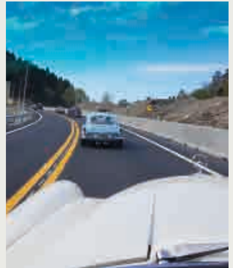
Lang rekke GVK bilar på veg mot Froland.