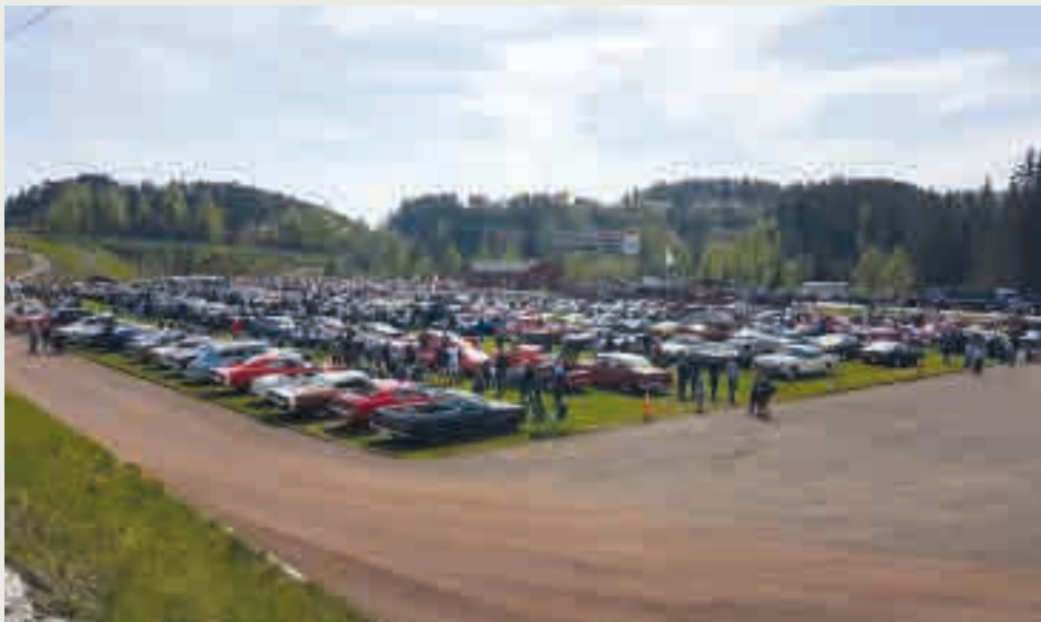
Overalt på Kringla Stadion stod det køyretøy.