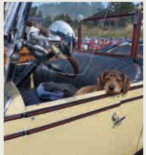
Nokre var meir avslappa enn andre.