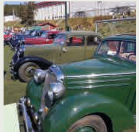
Imponerende 5 stk Mercedes 170 var samla, ein biltype som det stadig blir færre av her i landet på grunn av eksport til Tyskland.