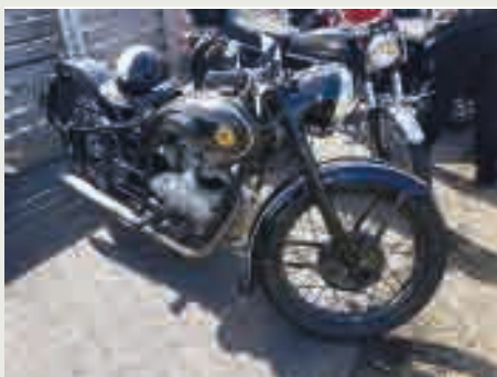
Aust-tyske Simson var ein gong ganske vanleg her til lands. Denne var flott.