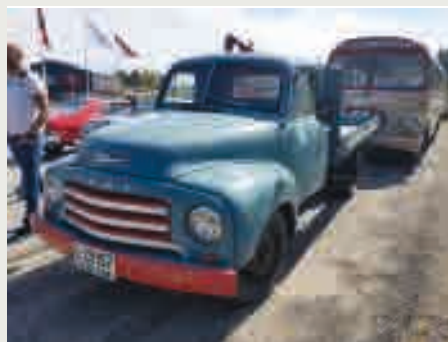
Bonde-Blitz såg proff ut med kranen klar.