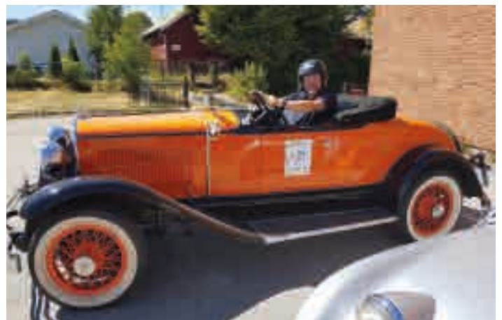
Fornøgd sjåfør med sjesteplass i sikte.