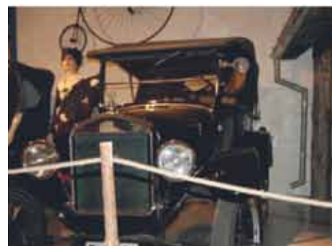
Sjekk de tidsriktige kostymene og sykkelene bak bilen.