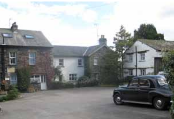
Tradisjonelt engelsk vertshus.

Flott utsikt fra vertshuset over det engelske landskapet.