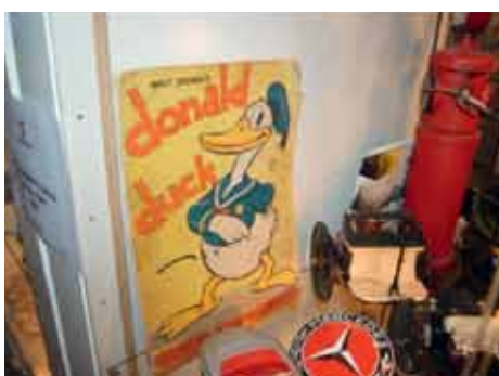
Førsteutgaven av Donald Duck fra 1935.