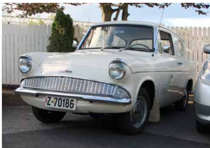
Steinars trofaste Ford Anglia.