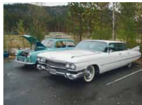
Det kom flere på besøk til museet.