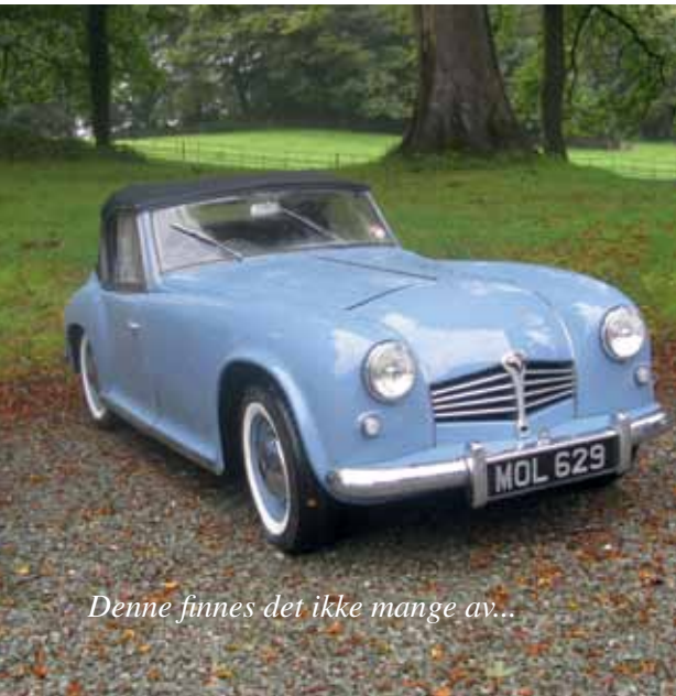
Denne finnes det ikke mange av...