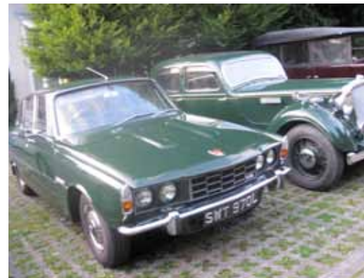
Gammelt og litt mindre gammelt...