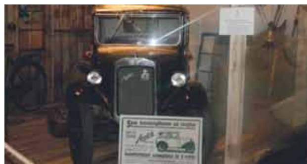
Austin i tidsriktig miljø.