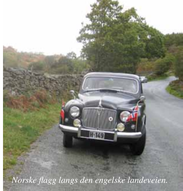
Norske flagg langs den engelske landeveien.