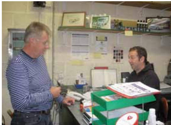
Arnhold handler deler hos Wearing.