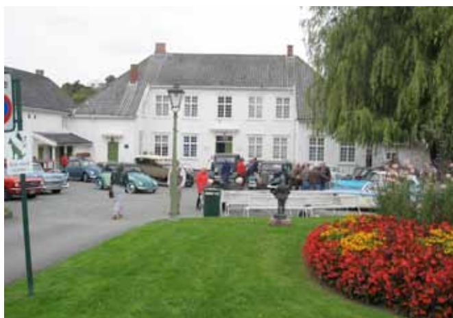
Bilene parkert foran museet, hvor mange engelske gjester var imponert over bilene våre.