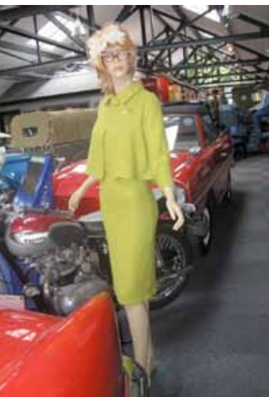
Ikke bare biler på museet...