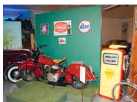
Tidsriktig og flott.