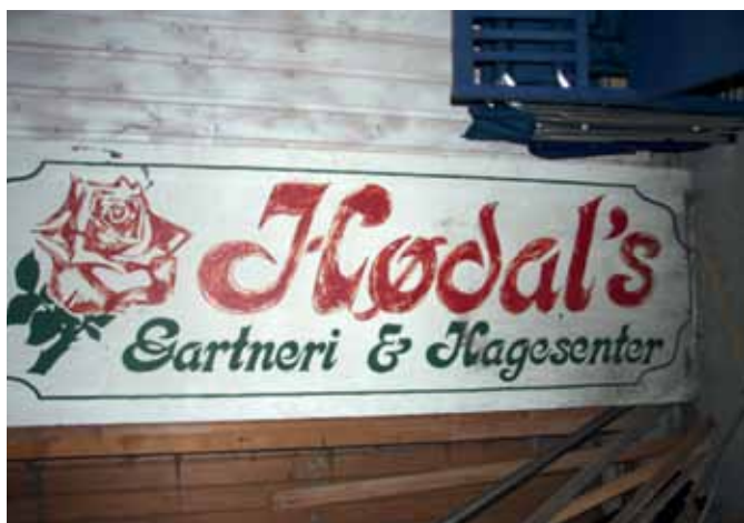
Hødals Garneri slik vi husker skiltet ved gamle E-18 ved Bommestad.