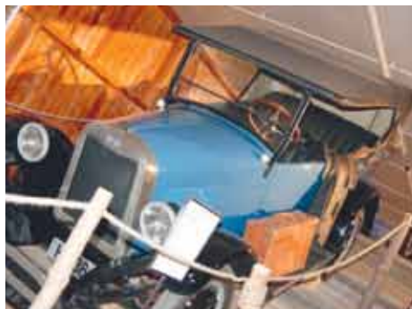
Chevrolet på plass.