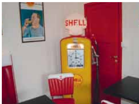
Fra kafeen. Se på bilde i bakgrunnen. Reklameskilt fra Lundetangens bryggeri.