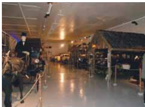
Oversiktsbilde av noe av lokalet.