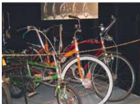
Hvem husker ikke Tomahawk eller Apasje sykkelene?