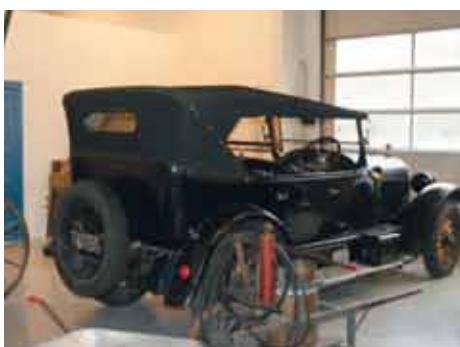
Hyggelig gjensyn med Buicken til Sigmund Aakvik.