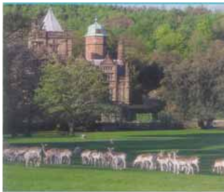
Møteplassen for rallyet...et slott!