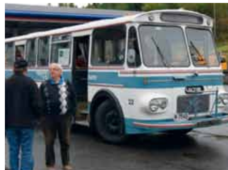
Takk for en hyggelig tur; Rutebilhistorisk Forening, og jeg vil med dette oppfordre medlemmene til å støtte opp om arrangementer uansett hvem som arrangerer.