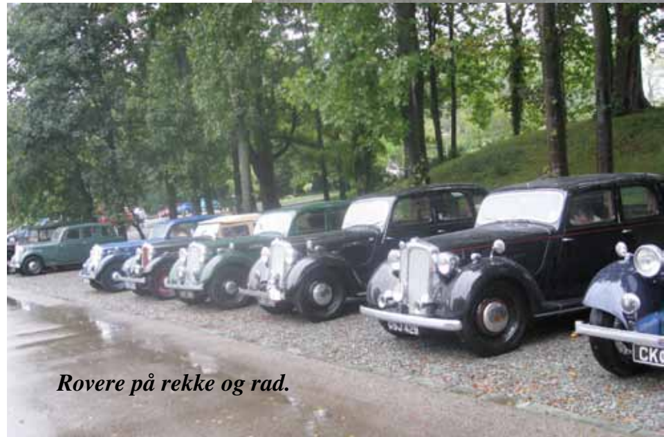
Rovere på rekke og rad.