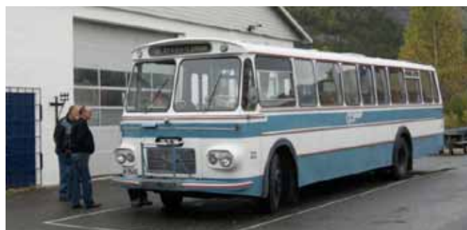
Bussen på plass utenfor Z-museum.

Vi takket for en hyggelig tur på Jønnevald kl 1800, akkurat tidsnok til at Odd supportere rakk andre omgang av fotballkampen den dagen.