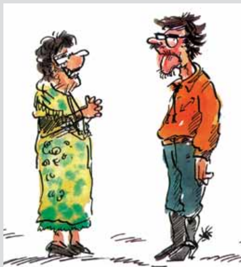
«HÅRESTATNING, PROGRESSIVE BRILLER OG FALSKE TENNER – MEN DU ER FORTSATT MIN LILLE TIGER!»