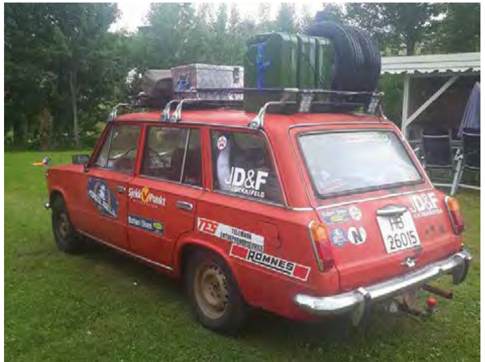
Klar for race. Mange lokale sponsorer.

Alle papirer var på forhånd klarert men det oppleves til tider kaotiske tilstander på enkelte