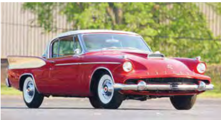
Dette er den siste Packard. Egentlig er det jo en Studebaker som ble bygget for Packard. Bare detaljer skiller disse to bilene fra 1958.