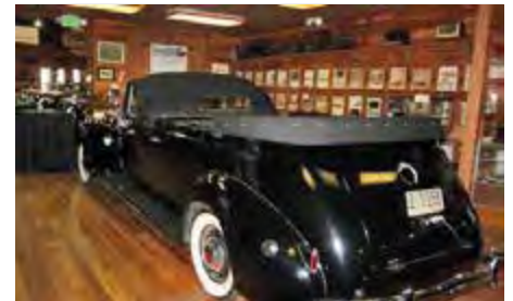
Hva er dette, jo en såkalt blomsterbil som kjørte i kortesjen i begravelse.