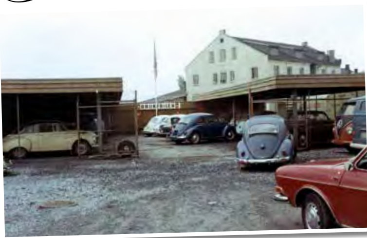
Grenland Auto i Porsgrunn 1969.