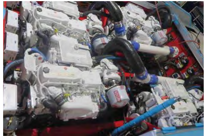
For de av dere som har greie på båter og ser nøye etter, ser at her er 4 stk. Arneson drev for overflatepropeller. Cummins kvartett.

sportsfisker rigget med allslags fasiliteter og elektronisk utstyr. Båtene var fra 35- 85 fot store og kundene krevde at de gikk virkelig fort. Med fra 3til 5 stk 400hk Mercury påhengere på hekken var flere av disse farkostene garantert over 100 knop! Det ble også levert innenbordsmotorer som på en 55 foter vi så som var nesten ferdig. Den hadde 4 stk 9 liters Cummins dieselmotorer med til sammen bort mot 2500 hk. Et imponerende syn det motorrommet der motorene var lakkert hvite. Denne doningen var bestilt av en Yath eier som skulle ha den på tvers inne i en "garasje" i båten sin.