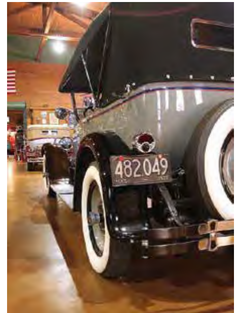
Det er ikke vanskelig å mene at dette er noe av det bedre fra tidlig -30 tallet.