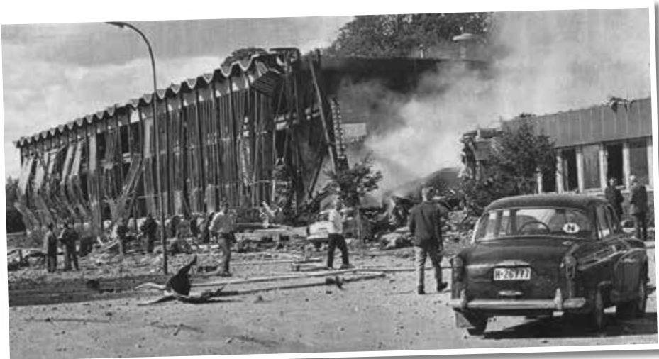
Grenge's hallen eksploderte 26. juni 1969.

Rådgiver spansk: Geir Havgar Tlf: 35 52 39 45 / 402 44 792 E-mail: geirhavgar@gmail.com