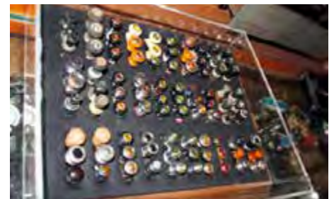
Kjempesamling av mer enn 200 sigarett- og sigar lightere