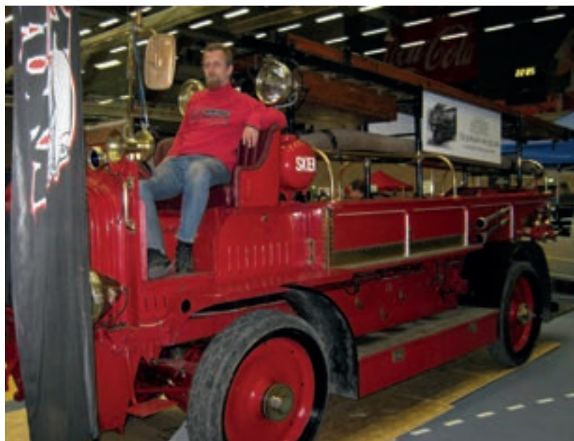
Høyre oppe: Brannbilen fra fylkesmuseet.