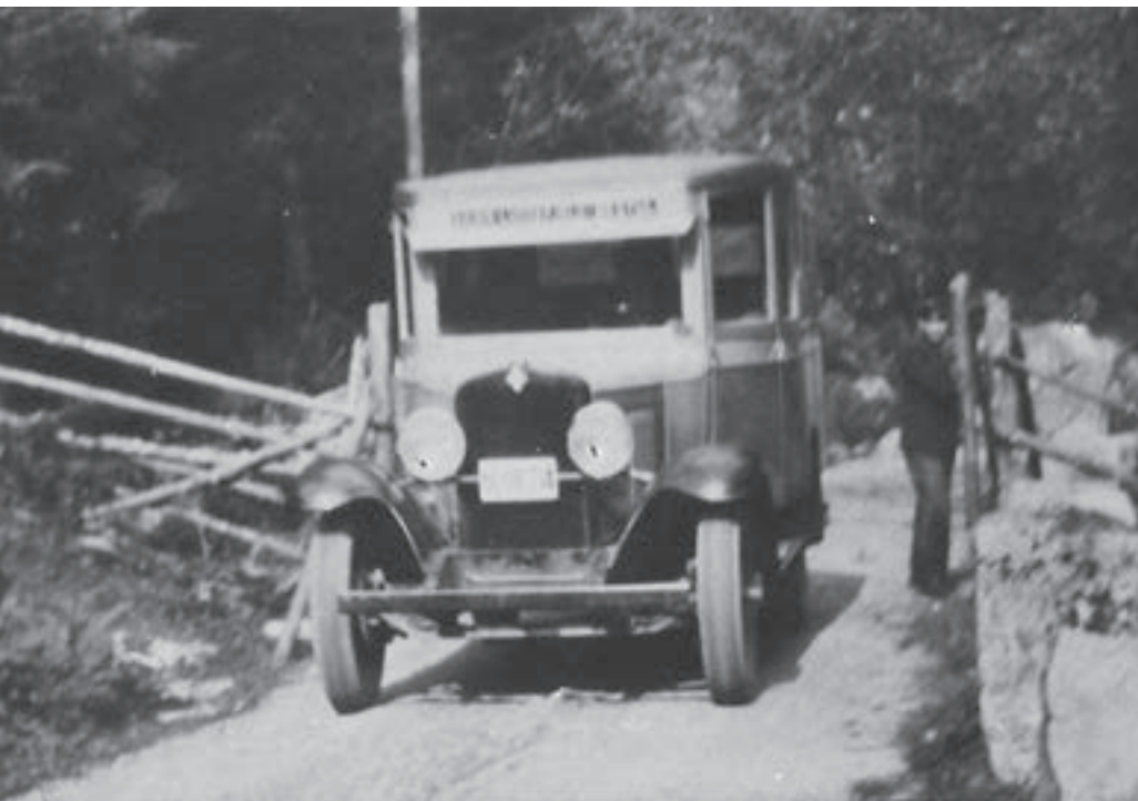
Buss på Luksefjellruta - Chevy 29.

med alt, og dermed visste det meste om folk.