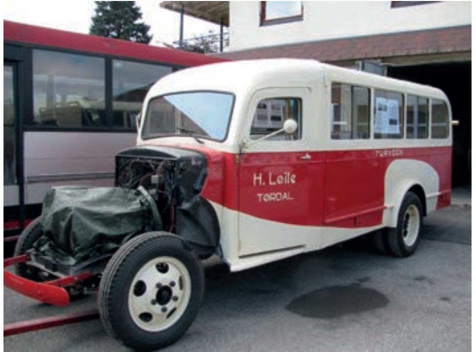
Rutebiler - busser 001