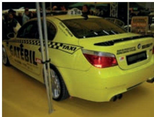
Høyre: Det var mulighet for å bestille tur med Norges råeste taxi, Gatebil taxien.