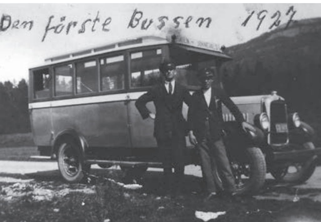
Første Norborg-bussen frå 1927 (Bjørn Bunkholts arkiv)

- Legg dei ned Landmannstorget, så gjer dei noe frøkteleg dumt. Må'ke finne på det! Folk skal fraktas inn til sentrum og der skal det og vere drosjer. Må'ke gjørra noe med det gamle torget, som har sendt bussar ut til alle kantar av fylket i snart 100 år. Har dei tenkt å avfolke