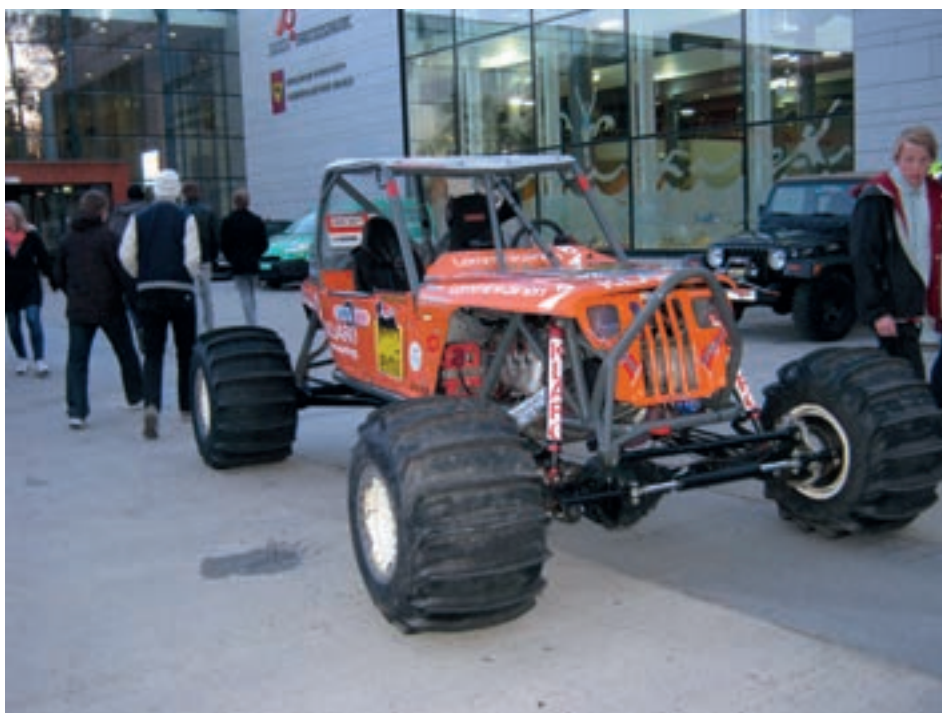
Over: Vi ble møtt i inngangen med terrengbiler som brukes i billøp i sandtak.

Store tribuner var satt opp for at publikum kunne se. Det var meldt om tåkeskyer over fritidsparken, og det klarte de bilene å lage med glans. Publikumsantallet ble anslått til å være 6000 mennesker. Etter en tur ute var det godt å komme inn i varmen. Der fikk vi se alt fra nye Porcher til den store gamle brannbilen til fylkesmuseet. Den er fra 1917 og veier 5 tonn. Forbruket har han som har pusset opp bilen greid å få ned i 6 liter på mila.