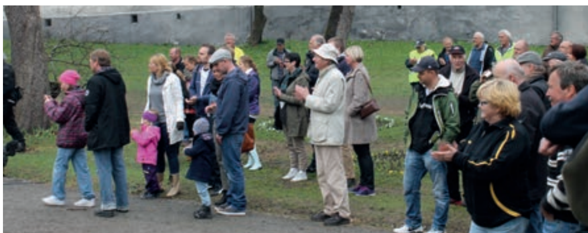
Et fuktig men entusiastisk publikum avventet juryens dom.