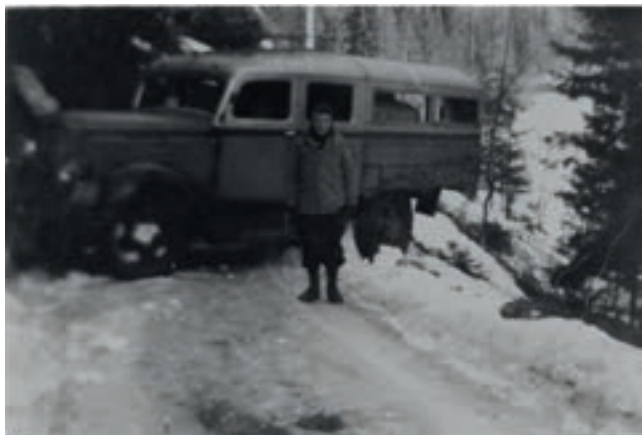
På glatta Luiksefjellruta.