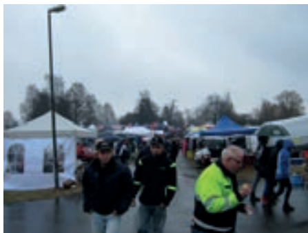
Kaldt, guffent, og glissent med folk.