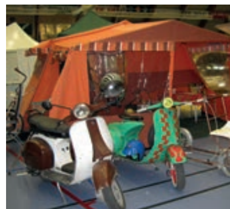
Høyre nede: Campingavdelingen, flott at noen tar vare på dette.