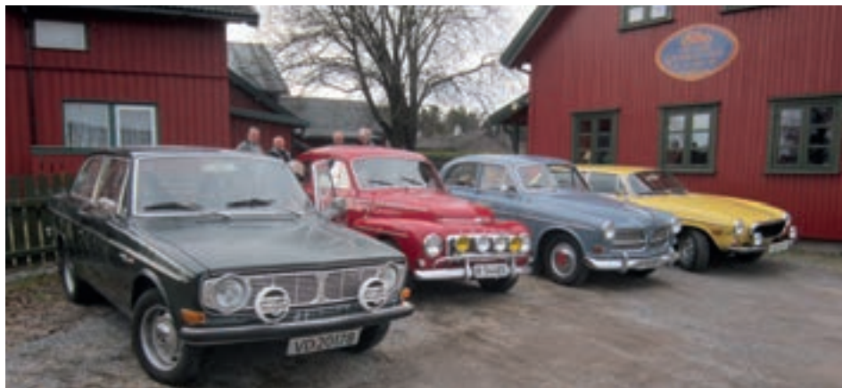
Tekst og foto: Andreas Cleve

For åttende året på rad ble det onsdag 17. april avholdt en samling for entusiaster av Volvo veteranbiler i lokalene til Grenland Veteranvogn Klubb (GVK) på Nenset i Skien.