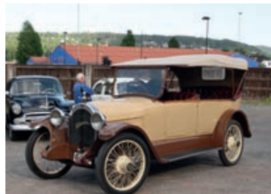
Bildet er av Trygve Hagen sin Oldsmobile 1917 som dukket opp for første gang på juni møtet.