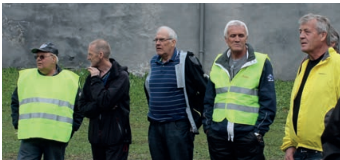
Funksjonærene fra veteranvognklubben kunne endelig slappe av og bivånte begivenheten på ærbødig avstand. Vel blåst gutter! Vi ser alle frem til neste års Grenlandsrally!