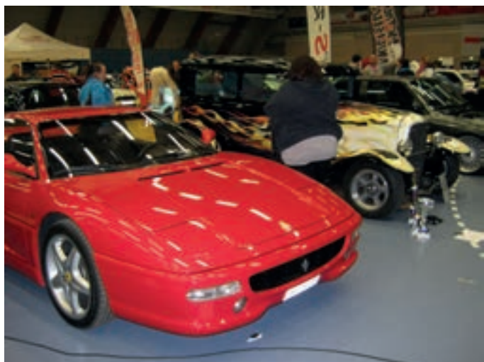
Over: Gammelt og nytt.