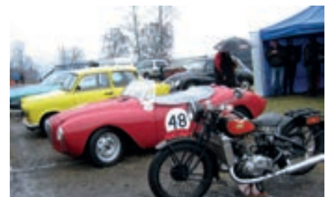
Diverse biler og klubber som hadde funnet veien til Ekeberg.