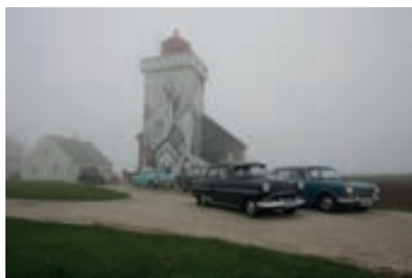
Obrestad fyr på Jæren

vene med glans på den veien som var i bruk så sent som 1945. Rally Monte-Carlo startet før krigen blant annet fra Stavanger og Tronåsen var en etappe i 1931. Etter at veien ble stengt er den i dag bare åpen som en kuriositet med enveiskjøring. En kan bare undre seg hvordan de gamle bilene kom over denne veien med bremsere bare på bakhjulene og grusvei, eller om det var en smule glatt. Etter denne opplevelsen fikk vi også med oss Bakke bru fra 1844 som den gang var Norges lengste hengebru med smidde stag.