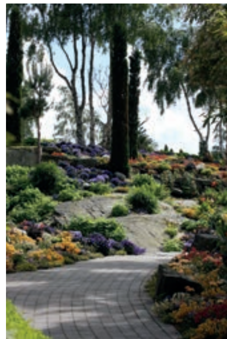
Flo og Fjære i sin blomsterprakt.

Da var det å sette nesa hjemover over Suluskar og mot Setersdalen. A-Forden med gåseflokken etter hadde bemerkelsesverdig godt driv og 65 kilometer begynte etterhvert å føles naturlig. Det skal sies at i bakkene gikk det like fort og Austin 1800 som jeg kjørte måtte kjøres på gear for at jeg skulle følge. Vi bikket over toppen og ankom Setersdalen med glødene bremer atter at vi som forsiktige sjåførere vi er hadde tatt oss trykt ned de bratte bakkene. Overnatting på Gullgården Hotell & Feriesenter på Rystad som føyde seg inn i rekken av de godt planlagte