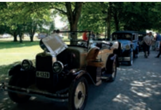
Mange spesielle biler.