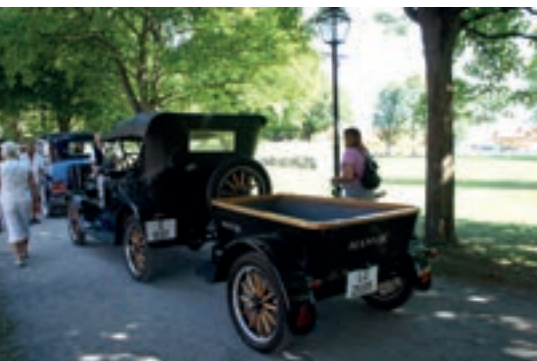
Morsomt med eiere som gjør noe mer med kjøretøyet sitt. Her er en som har laget en matchende tilhenger.