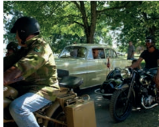
Motorsykler godt repressert ved Gladløpet.