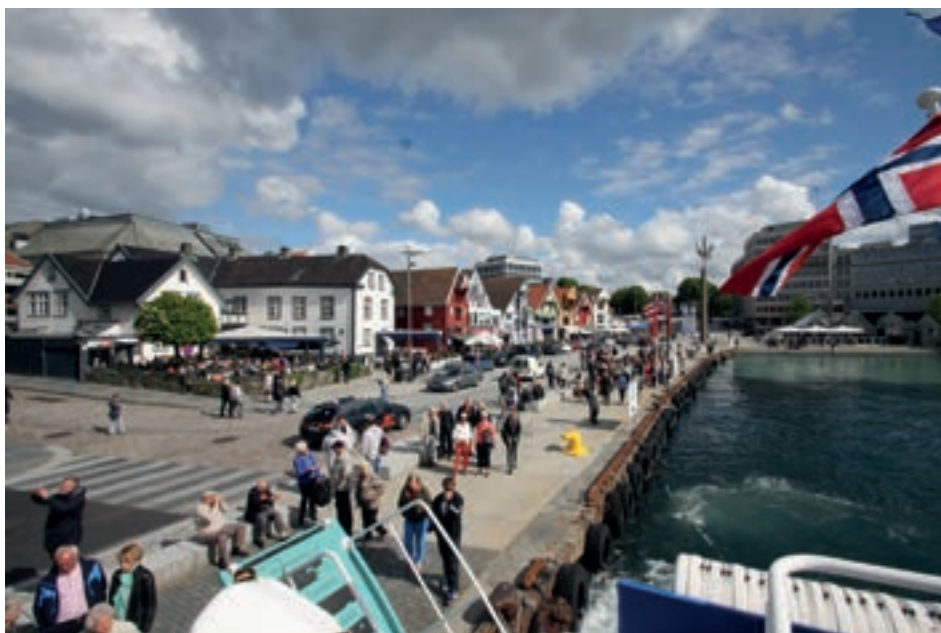
Vågen i Stavanger

Videre gikk ferden til Byrkjedal der vi spiste det noen kaller lunch. Jeg valgte spekefat og fikk en tallerken med 4 salpøseskiver og to aspasp-