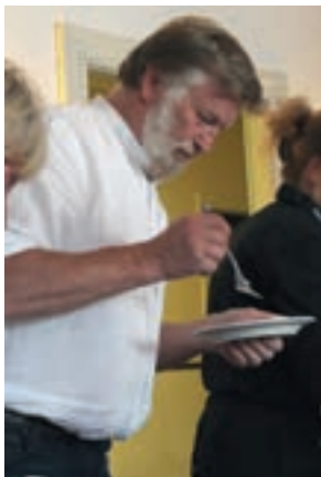
Enkelte besøkte buffeen opp til flere ganger.