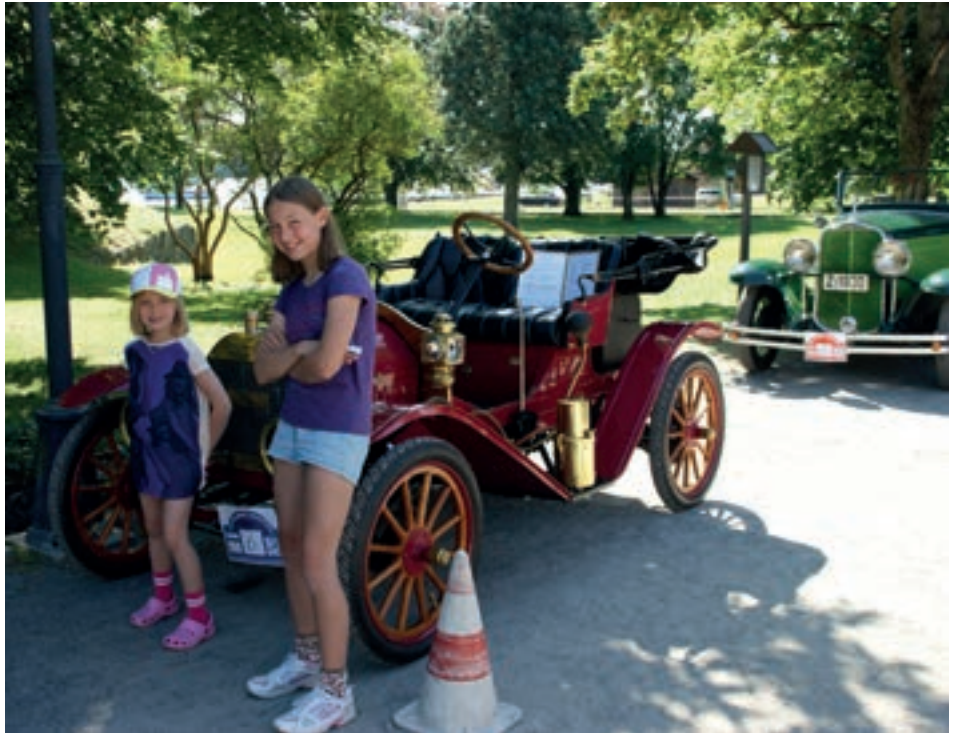
Jentene mine foran løpets eldste bil.

Med 194 kjøretøy var det mange som skulle av sted. "Verdens hyggeligste bilkø" må vel være betegnelsen på startområdet. Bord og stoler stod fremme, og gamle slagere strømmet ut av sveivegramofonen fra en bil som stod ganske langt fremme i køen. Mange kjente biler fra Grenland var ankommet, samt mange biler jeg fikk se for første gang. Arrangørene var heldig med været, noe som ga en flott ramme på et flott arrangement.