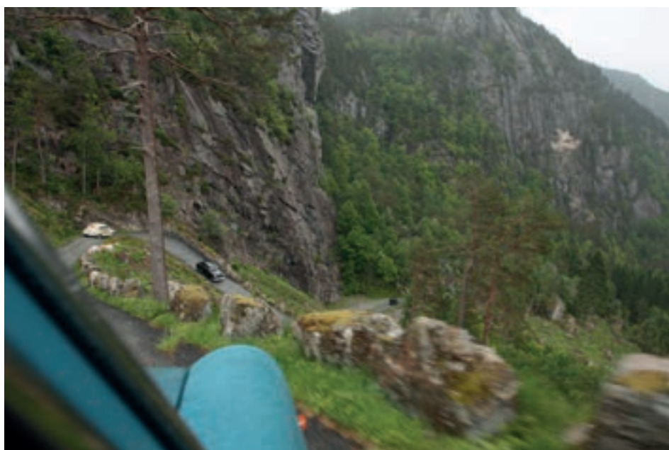
Dette bilde viser hvor bratt det er i Tronåsen. Her er vi på vei ned på andre siden.

Fredagen opprandt med brukbart vær og dagen var avsatt til besøk