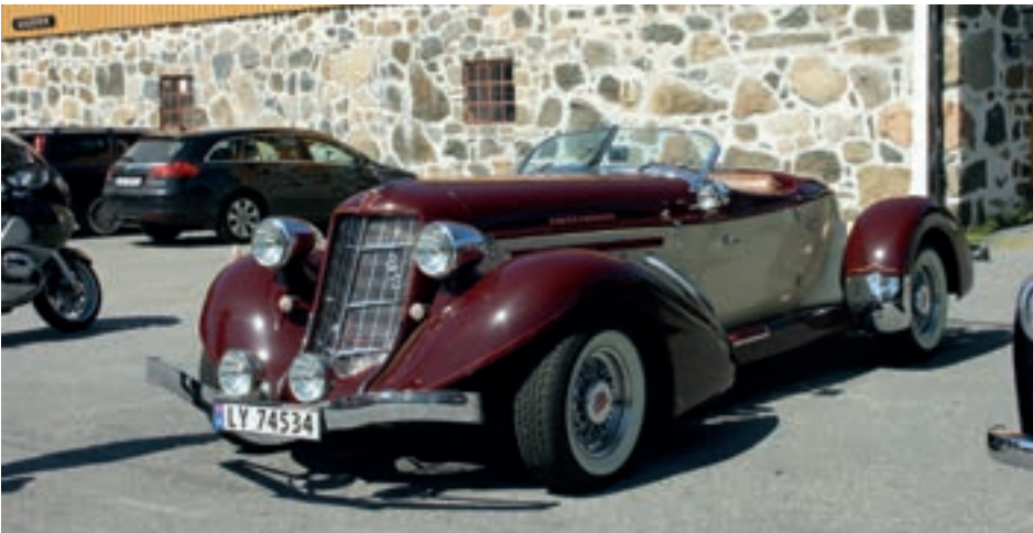
Gladløpet Auburn Speedster 1936 R-8 Supercharged.