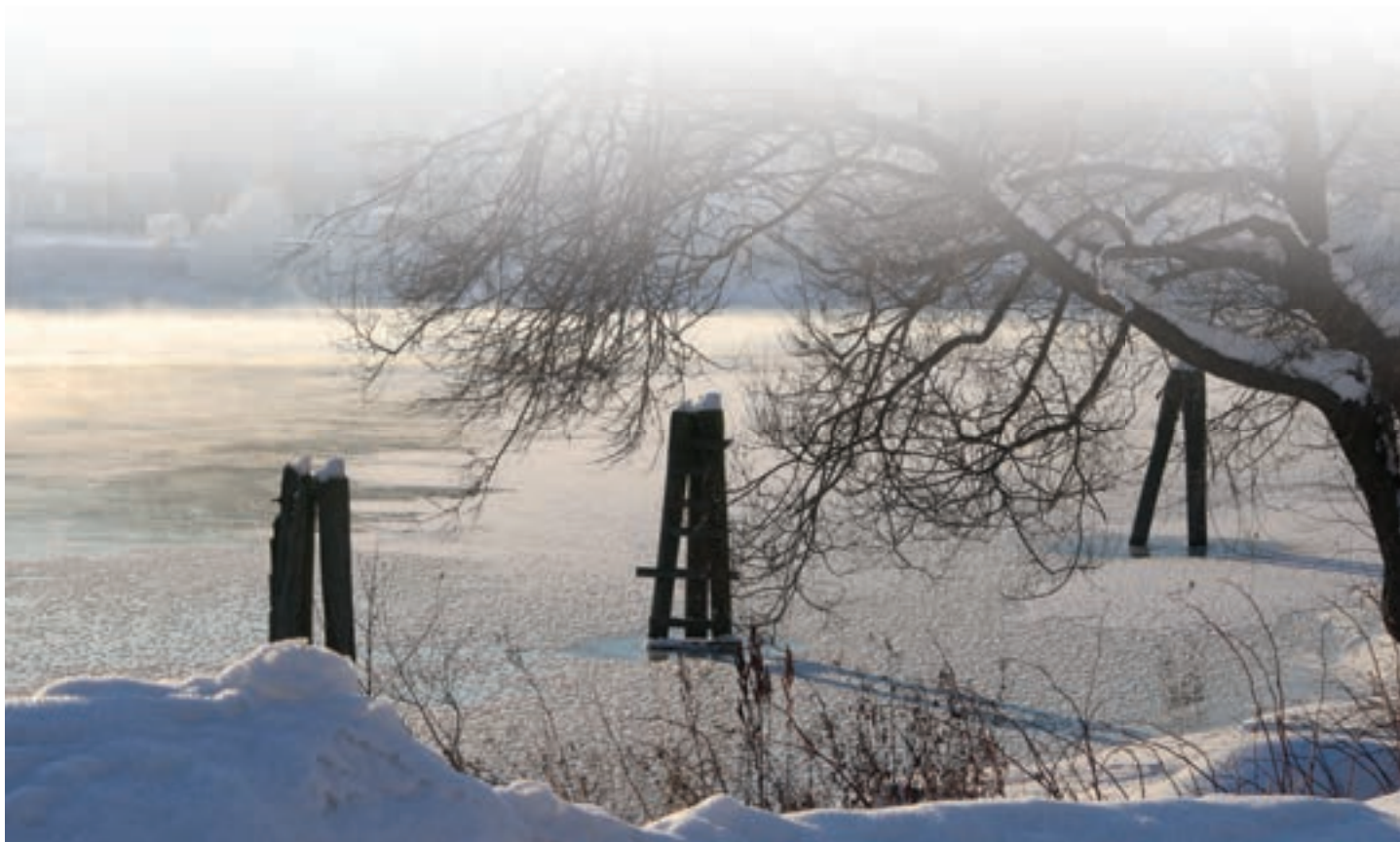
Fra Bakkestranda.