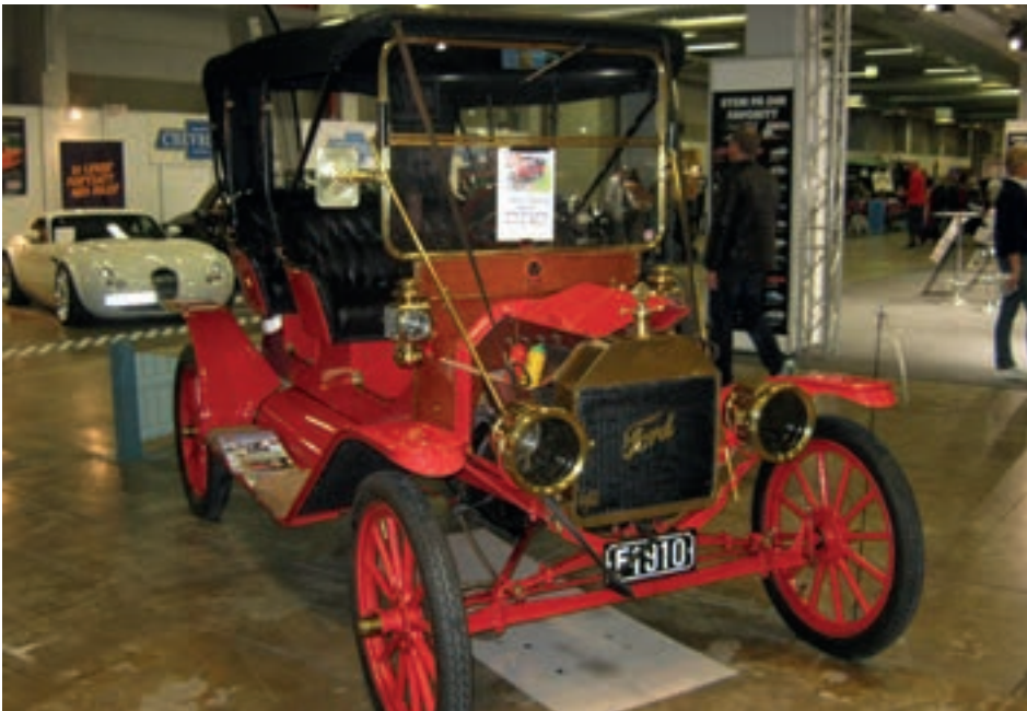
T-Ford som er til salg, minstepris kr. 200 000,-