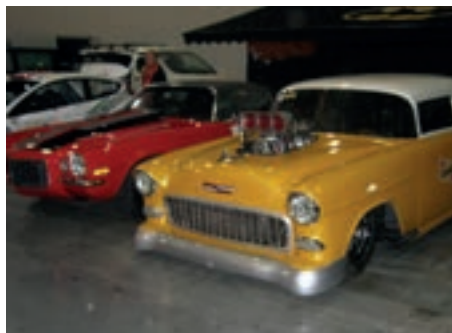
Gøy med stor motor.