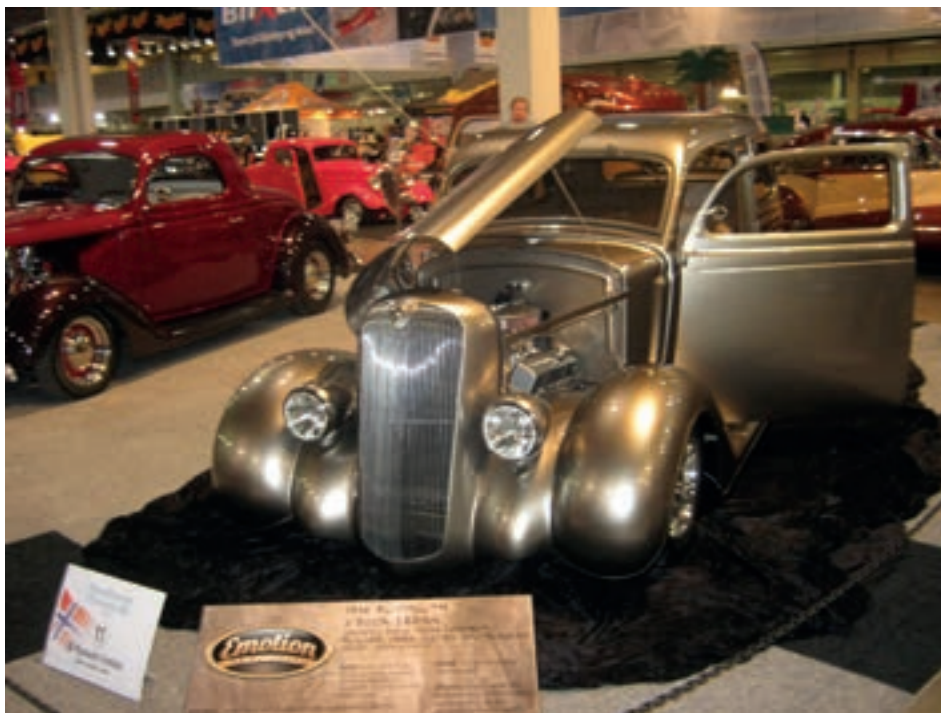
Plymouth 1936 modell. Modifisert.

For fjerde året på rad ble Oslo Motorshow arrangert. Messen avholdes på messesenteret på Lillestrøm i oktober. Det var alt fra de minste modellbilene hos Jans (Aarstad) modellbiler via radiostyrte lastebiler, veteranbiler, modifiserte biler, nye biler, motorsykler, og de største og flotteste lastebilene.