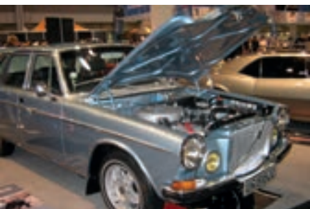
Fantastisk flott Volvo 164. På batteriet stod det en helt lik modellbil.