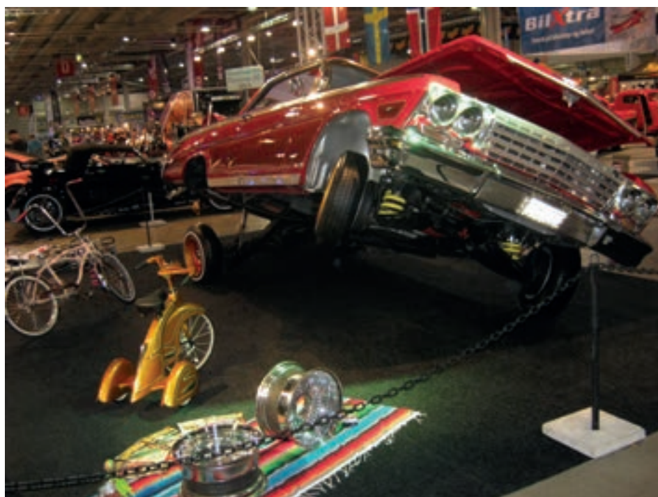
Slik kan også støtdempere monteres. Legg merke til den modifiserte trehjulsykkelen.