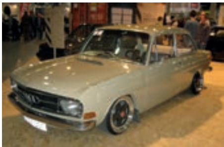
Sjekk felgene på denne Audien.