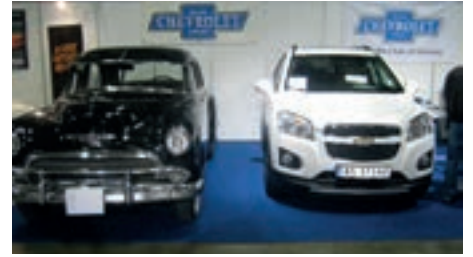
Ny og gammel Chevrolet side om side.