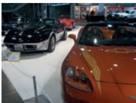
Chevrolet Corvette og Ford Mustang så langt øyet kan se.