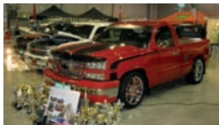
Flere bilfirmaer var representert med nye biler. Her er vel drømmebiler for mange, en praktisk Pick-Up med stor motor.