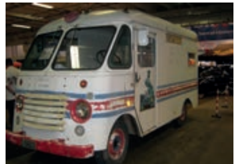
Det var også plass til en gammel melkebil.