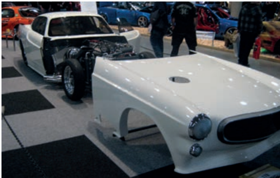
En Volvo P 1800 som har stoppet så hardt at fronten datt av.

Oslo Motorshow er en opplevelse for store og små, og kan anbefales. Neste år er det 5 års jubileum.