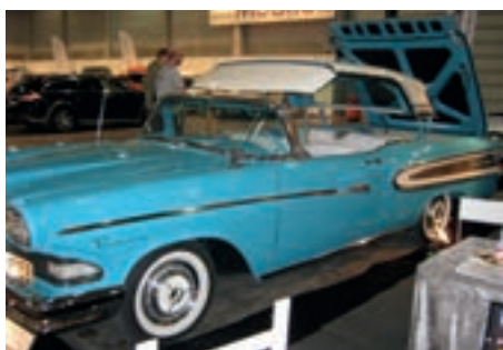
Dette har vært 3 biler, bygget om til 1.