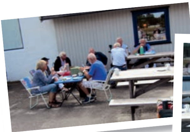
Det å kose seg med mat på tur i sammen er hyggelig.