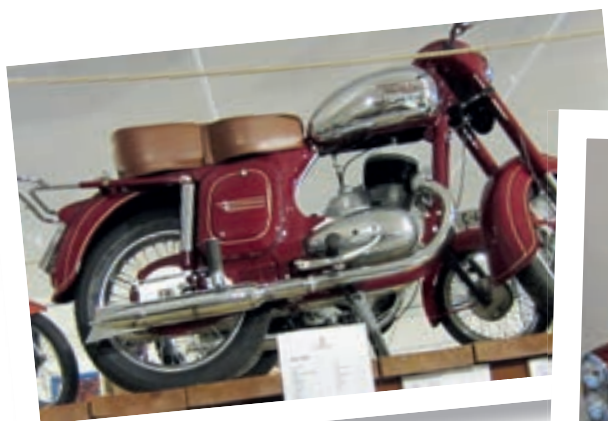
Java 250 ccm.