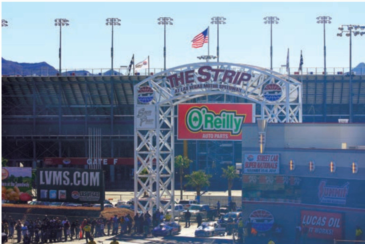
The Racing strip i Las Vegas.

ytelse 8500-10000 hestekrefter teoretisk. Kompressjon 1:6,5 og lade-trykk på opp til 5 bar! Kompressoren