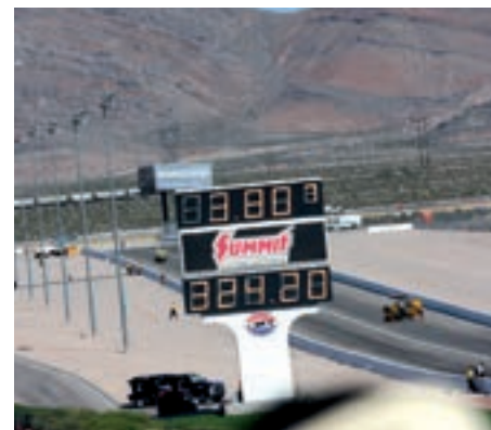
Og her er resultatet.