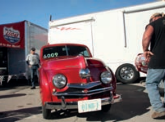
Men hva er dette?

stillestående til målstreken tar det 3,8 sekunder og hastigheten kommer opp i 515 km/t.