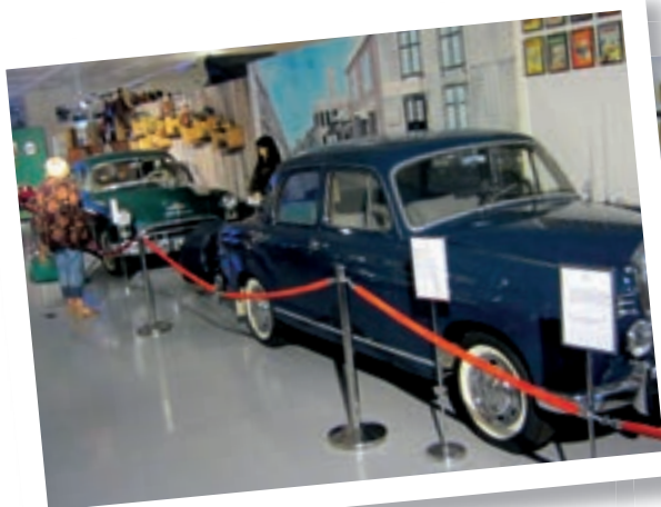
Mercedes og Chevrolet.