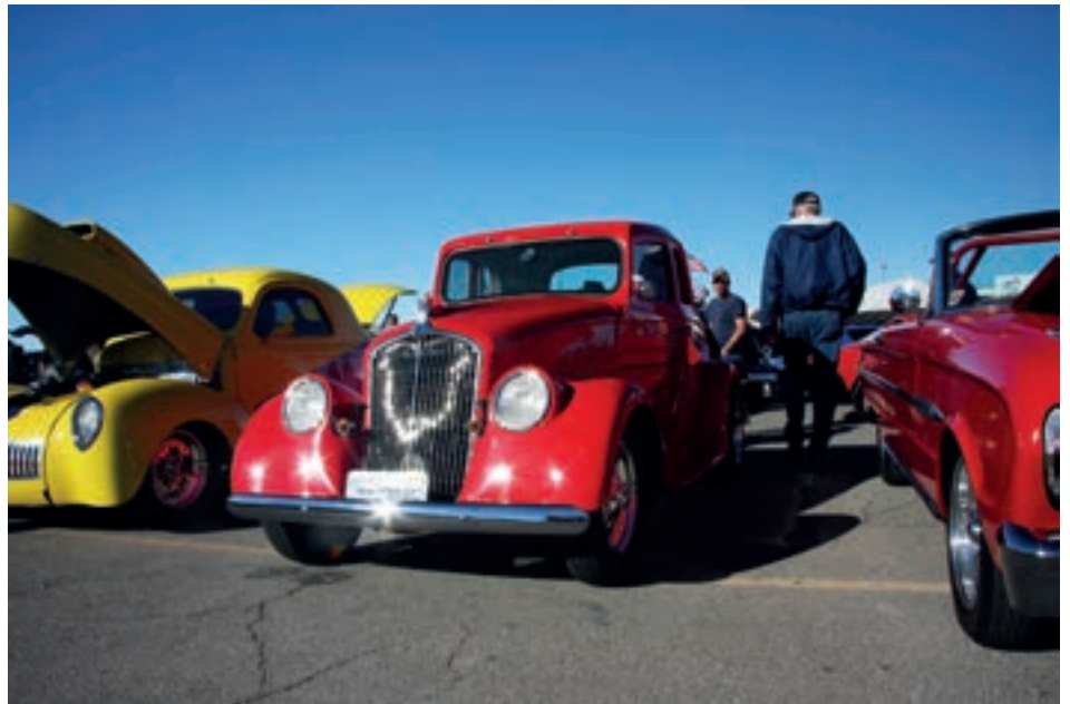
Dette var også en dragster.

Da ingen av oss hadde opplevd "Top-fuel" dragster før var forventningene skyhøye. En kan mene hva en vill om denne motorsportformen som går rett fram kun 402 meter (top fuel 1000 fot). Dette er ramme alvor, maksimal ytelse, nitro metan, lyd, lukt er noen av stikkordene en må bruke for å beskrive dette sirkuset. De som hadde glemt hørselværn hadde det mindre komfortabelt.