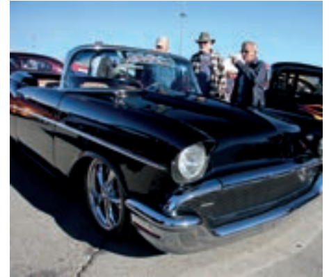
Her diskuterer gamlegutta dragracing.

Opplevelsen var utrolig og i.o.m. at vi fikk se mange klasser og at depot var åpent for publikum gjorde det enda bedre. For enkle Bamblinger er det mange inntrykk som ble festet på film. Slike store arrangementer er alltid velarrangerte i USA.