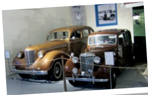
Noen av kjøretøyene på museet.