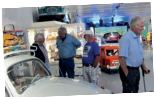
Gutta har en hyggelig prat og smilet er alltid med.