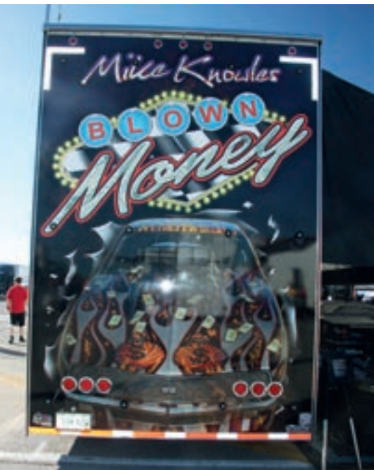
Utifra taksten ser det ut at dette koster penger.

Utviklingen i denne sporten har gått fort og er nå kommet til et nivå der