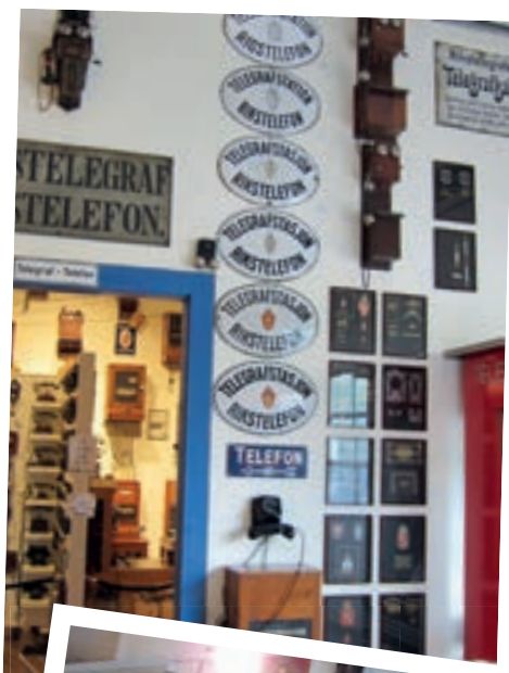
På museet inngår en enorm samling av gamle telefoner og tilhørende utstyr.