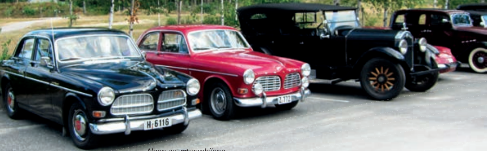
Noen av veteranbilene som ble brukt på turen.

Knut Brekke og gode venners tur til Z museum i Treungen.